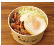
炭火焼チキンと照焼ソースの たまご丼 592円(税込)