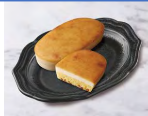
UC むぎゅ濃チーズケーキ 203円(税込)