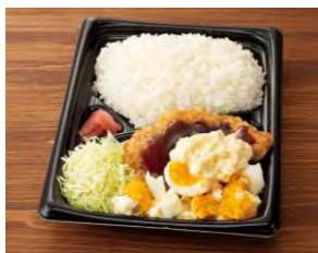
ゴロゴロたまごと照焼ソースの 鶏竜田揚げ弁当 592円(税込)