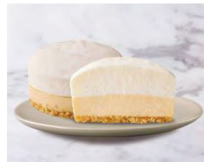
UC ふわ濃チーズケーキ 254円(税込)