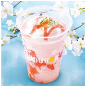
アイス桜オレ ~桜もち仕立て~