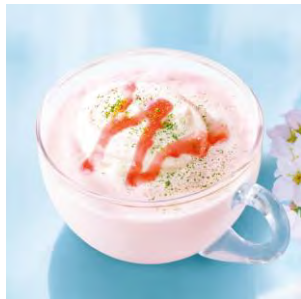
桜オレ (ホットドリンク)